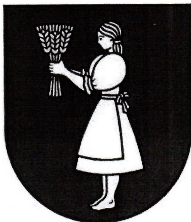
Erb obce :